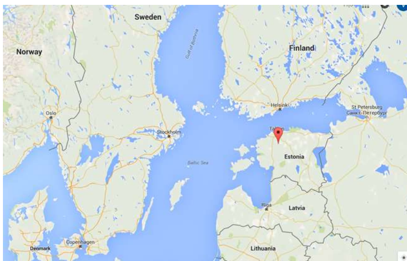
Joonis 1 Warmeston OÜ Purila tootmisüksuse asukoht

Warmeston OÜ on Eestis tegutsev puidugraanuli tootja, kes omab kolme tootmisüksust Eestis. Käesolev päritoluraport kirjeldab tootmisüksust Purila tootmisüksust Rapla maakonnas, Purila külas, vaata joonist 1.