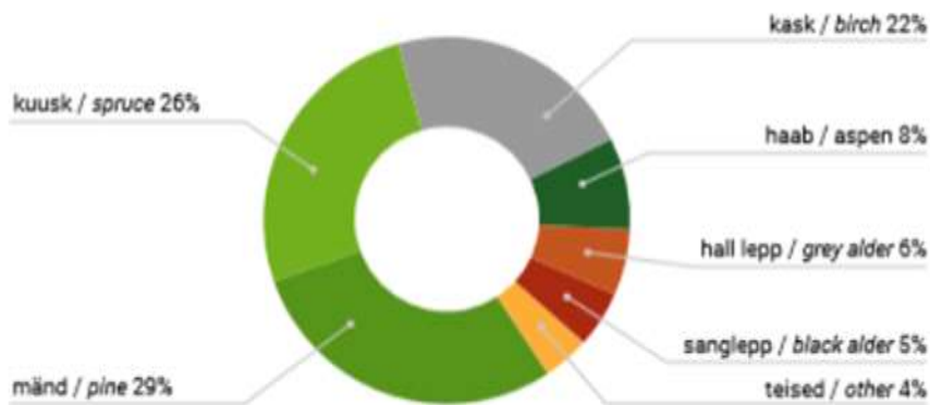
Joonis 2. Kasvava metsa puuliigiline jaotus (Metsa aastaraamat 2017)

Eesti kasvava metsa puuliigiline jaotus on esitatud joonisel 2.