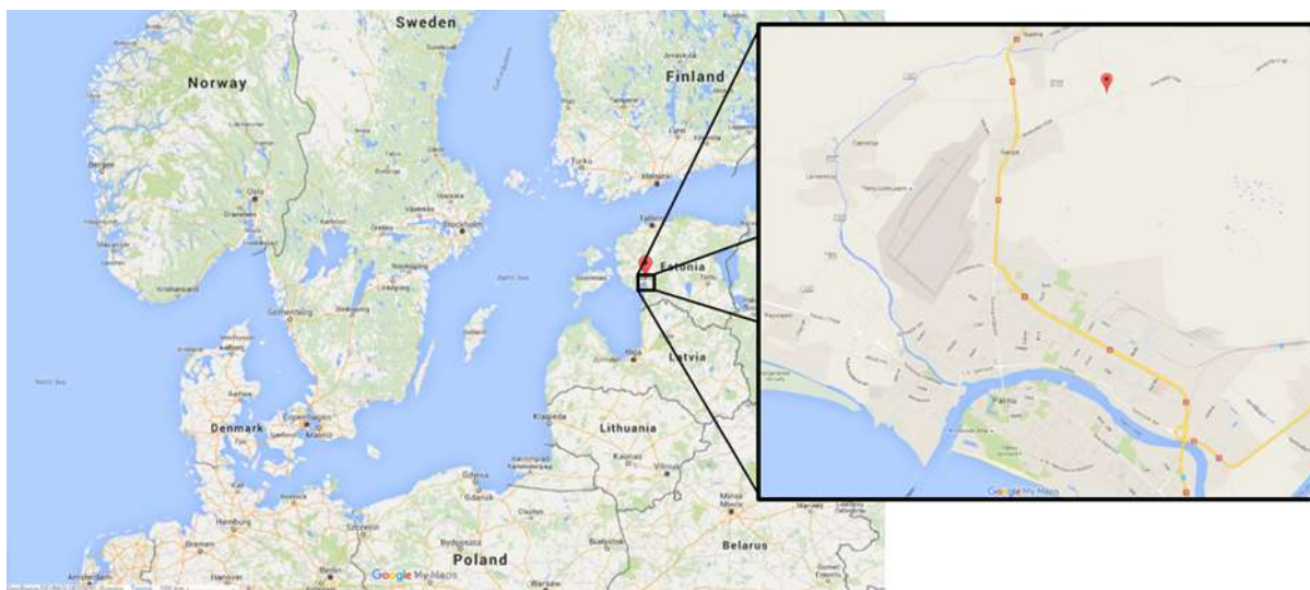
Joonis 1 Warmeston OÜ Sauga tootmisüksuse asukoht (google kaart)

Warmeston OÜ on Eestis tegutsev puidugraanuli tootja, kes omab kolme tootmisüksust Eestis. Käesolev päritoluraport kirjeldab tootmisüksust Saugal, mis asub riigi edela osas ca 12 km kaugusel Pärnu sadamast. Tootmisüksuse asukoht on näidatud joonisel 1.