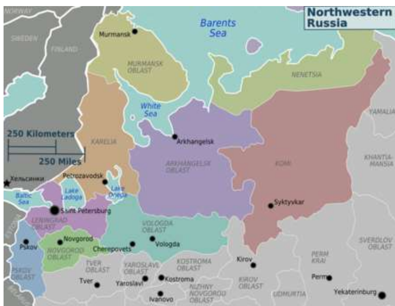
Joonis 3. Loode-Venemaa piirkond

Osa kuuse ja männi järeltööstusest pärit toorainest võib pärineda Venemaa loode osast (ala suurus ca 60 miljonit ha), Venemaa metsad on pool-looduslikult majandatud metsad, kus kasvavad kohalikud puuliigid, Puude istutamine ei ole Venemaal laialdaselt kasutatav metsamajandamise praktika. Metsa alad on soodsaks keskkonnaks looduslike okaspuuliikide loomulikuks taastootmiseks (mänd ja kuusk).